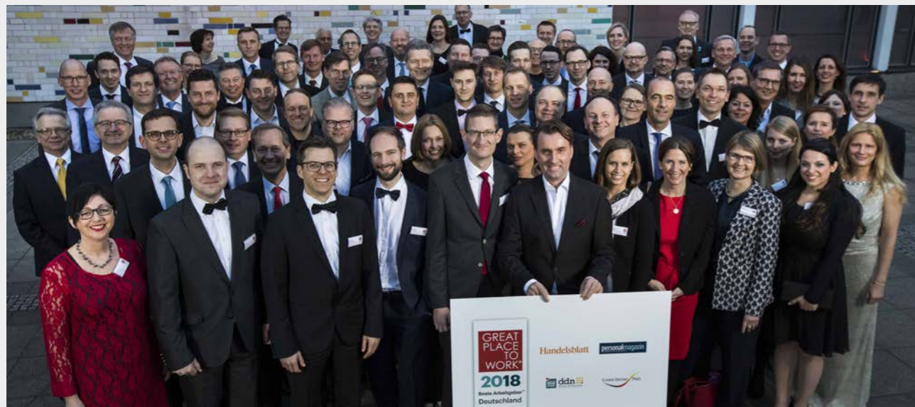
NEUMÜLLER erhält auch 2018 die Auszeichnung als einer von Deutschlands besten Arbeitgebern.

NEUMÜLLER hat dabei die Jury überzeugen und die Preise gewinnen können. Danke an alle, die für uns gestimmt haben!